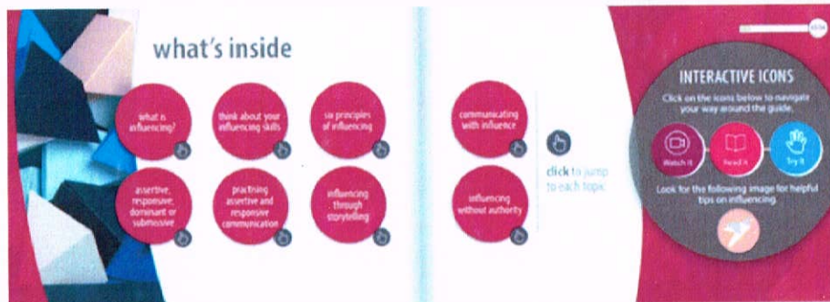
Интерактивная электронная книга