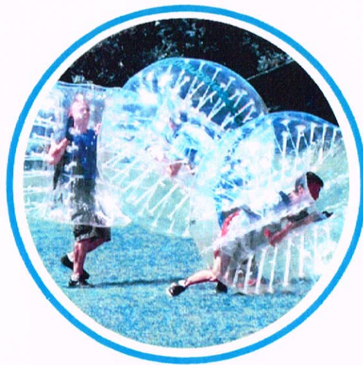
Мероприятия по созданию команды