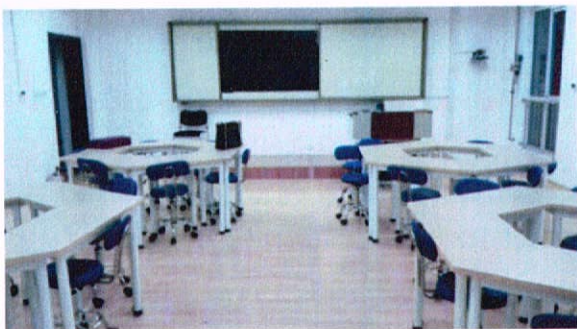
Интерактивная комната для записи